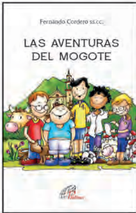
Ilustración de portada